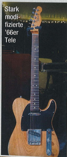
Stark modifizierte '66er Tele