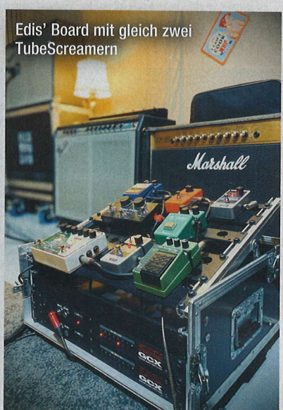
Edis' Board mit gleich zwei TubeScreamern