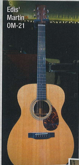
Edis' Martin OM-21

Die Schweizer von der Ellis Mano Band machen Blues-Rock alter Schule. Wir sprachen mit Gitarrist Edis über seine Vintage-Gear-Sammlung und seine musikalischen Einflüsse