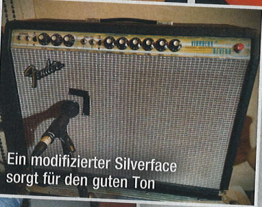
Ein modifizierter Silverface sorgt für den guten Ton

alle Videos. Live bin ich für die Technik zuständig, kümmere mich um das sonstige Business und noch ganz viel mehr. Aber eigentlich will ich ja nur Gitarre spielen.... Tja, bis das Ganze eine gewisse Bekanntheit und Größe erreicht hat, ist das halt nötig, und versteh mich nicht falsch, ich mache das unglaublich gerne.